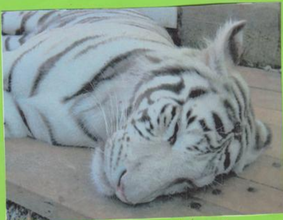
LAKADLO ZOO V LIBERCI - BÍLÝ TYGŘ

DRUHÁ ZASTÁVKA BYLO V ZOO LIBEREC. DĚTI SE ROZPECHLY PO ZOOLOGICKE ZAHRADE A VYPLŇOVALI PRACOVNÍ LISTY. VELKOU ATRAKCÍ BYLI BÍLÍ TYGŘI.