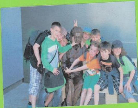
PŘED IQ LANDIA

POZNÁVÁME ČESKÁ MĚSTA - LIBEREC 21.5. - 22.5. 2014