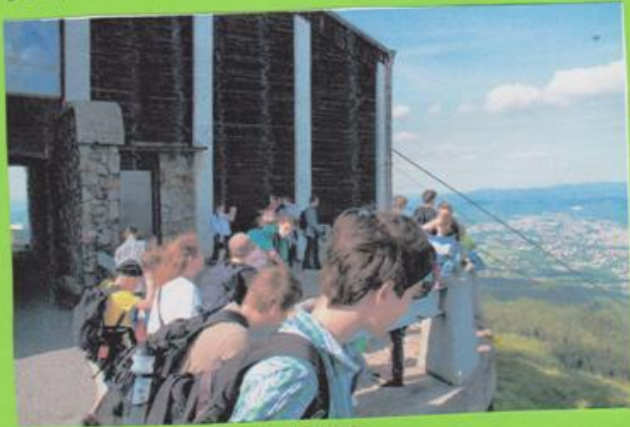
PO VYSTUPU Z LANOVKY

NA ZPĚTEČNÍ CESTĚ JSME SE ROZDEĚLILI NA DVE SKUPINY. VĚTŠÍ SKUPINA ODEŠLA Z JEŠTĚDU DRÍVE A DO ÚDOLÍ SESTOUPILA PĚŠKY. DRUHÁ SKUPINA ODJEZDĚLA ZPĚT LANOVKOU.