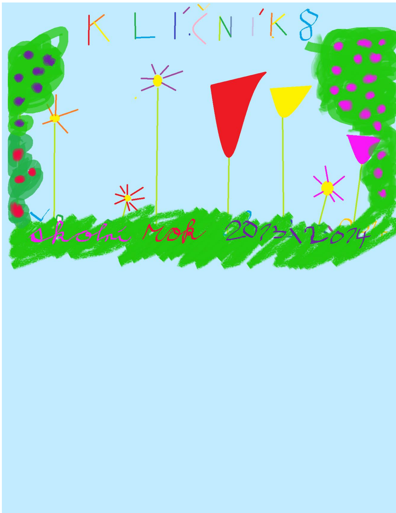
Anička Glatteřová - 3.třída