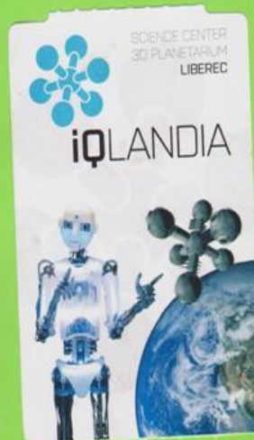
VSTUPENKA DO PLANETÁRIA

PRVNÍ ZASTÁVKA V LIBERCI BYLA IQ LANDIA - ZDE JSME NAVŠTÍVILI PLANETÁRIUM A EXPOZICE TÝKAJÍCÍ SE ČLOVĚKA. DĚTI SI VYZKOUŠELY MINDBALL, PÁKU, SHVSLY A DALŠÍ ZAJÍMAVÉ VĚCI.